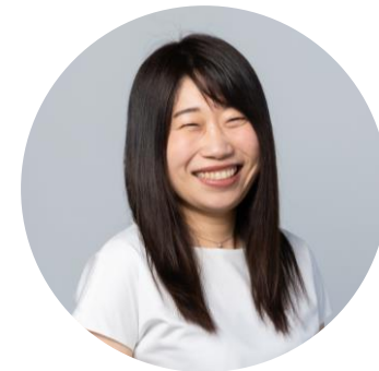
編集担当 須貝未菜